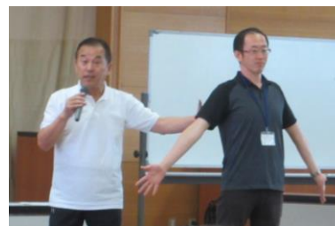
→過去の講座の様子↓

小牧市では、住民が主体となって健康づくりに取り組めるよう、介護予防の基礎知識や誰でも無理なくできる体操を学び、地域での活動に取り組むリーダーを養成しています。コロナ禍のため約3年ぶりの開催です。地域づくり、健康づくりに関心のある方、サロンの仲間同士等、みなさんの参加をお待ちしています。