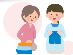
共に行う衣類の整頓