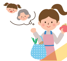
本人分以外の買い物