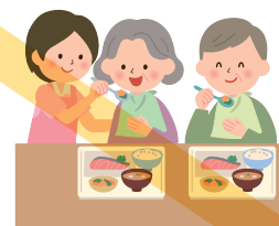
ご家族への家事対応