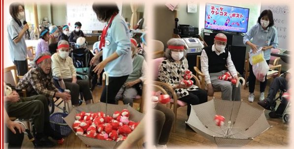
レッド・ホワイト 玉入れ競争！