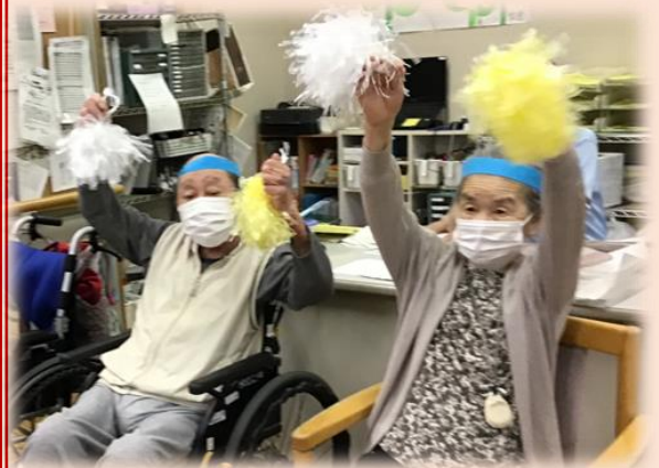
☆ミチアボーイ・チアガールの皆さん