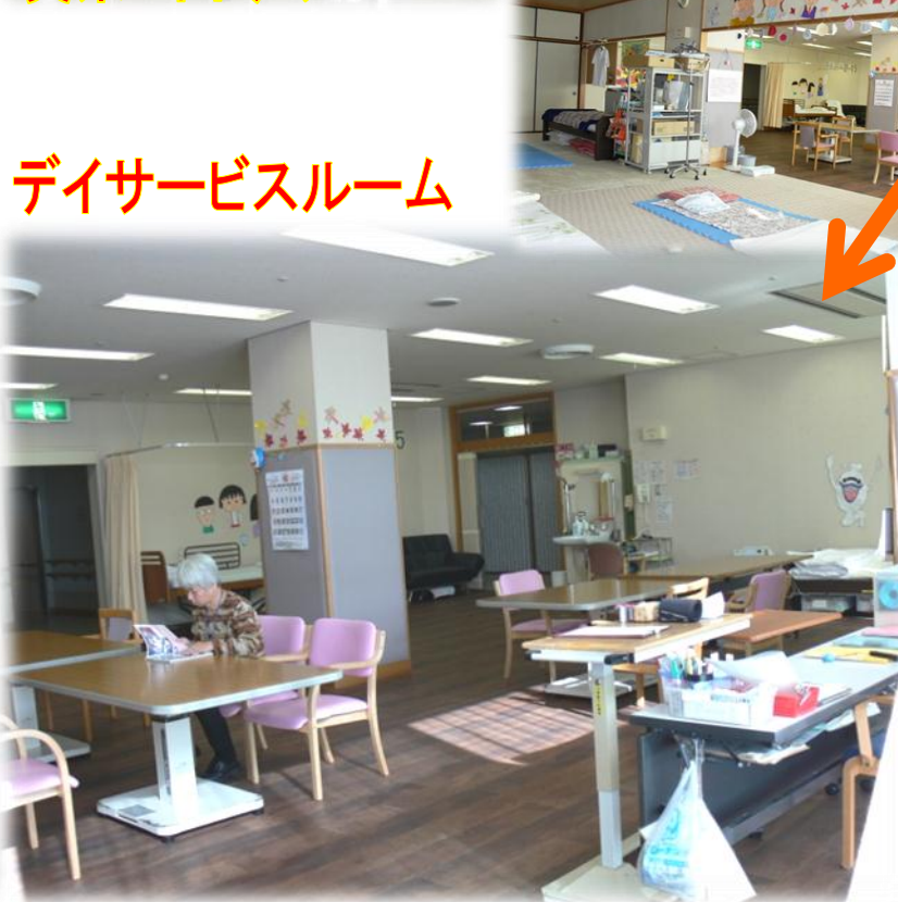
デイサービスルーム