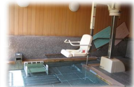
車イスで入浴 座浴