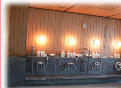
手すりにつかまり入浴