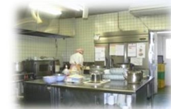
いつもアツアツごはん

自慢のひのき風呂です。座浴、歩浴、寝台浴の3種類あります。また同性介助ですので、安心してゆっくり入浴いただけます。