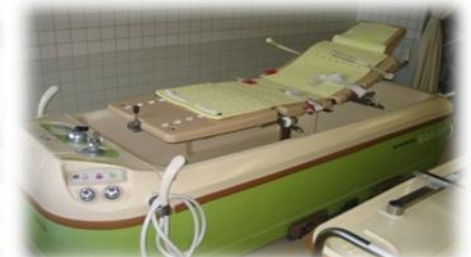
寝たまま入浴 寝台浴